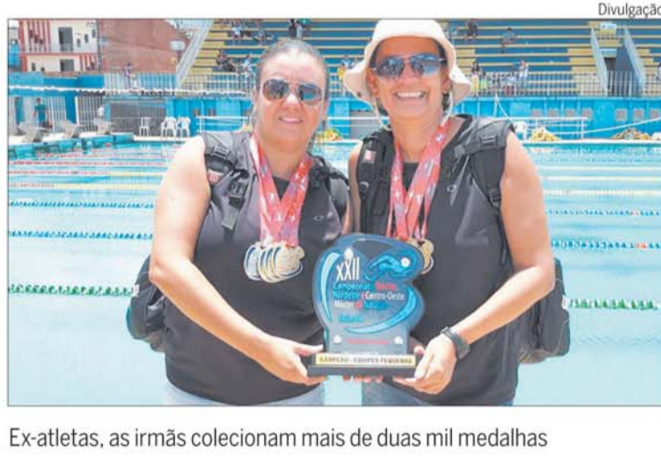
Ex-atletas, as irmãs colecionam mais de duas mil medalhas

Elas, que nadam há 32 anos e têm mais de 2 mil medalhas, além de troféus, diplomas e moções, foram